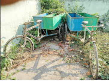
ପାଣିରେ ପଡ଼ିଲା ଲକ୍ଷ ଲକ୍ଷ ଟଙ୍କା

ନିଷ୍କନ୍ଦକୋଇଲି,(ନି.ପ୍ର) : କେନ୍ଦ୍ର ସରକାରଙ୍କ ପକ୍ଷରୁ ସୃଷ୍ଟି ଭାରତ ମିଶନ(ଗ୍ରାମୀଣ) ଜରିଆରେ ଗ୍ରାମାଞ୍ଚଳର ପ୍ରତ୍ୟେକ ସ୍ଥାନକୁ ସଂପୂର୍ଣ୍ଣ ବର୍ଜ୍ୟବସ୍ତୁ ମୁକ୍ତ କରିବା ପାଇଁ ଏକ ସଂପୂର୍ଣ୍ଣ ବର୍ଜ୍ୟବସ୍ତୁ ମୁକ୍ତ ଭାରତ ଯୋଜନା ପ୍ରଣୟନ କରିଛନ୍ତି । ଏହି ଯୋଜନାରେ ଗ୍ରାମାଞ୍ଚଳର ପ୍ରତ୍ୟେକ ବ୍ୟକ୍ତିମାନଙ୍କୁ ବ୍ୟକ୍ତିଗତ ଭାବେ ଆବର୍ଜନା କୁଷ୍ଠ ଯୋଗାଇ ଦିଆଯାଇଥିବା ବେଳେ ଖୁବ୍ ଶ୍ରଦ୍ଧାରେ ଏବଂ ପଞ୍ଚାୟତ ସ୍ତରରେ ମଧ୍ୟ ଲକ୍ଷ ଲକ୍ଷ ଟଙ୍କା ଅନୁଦାନ ଯୋଗାଇ ଦିଆଯାଇ ଜୈବ ବିଯତନ ଆବର୍ଜନା କୁଷ୍ଠ ନିର୍ମାଣ କରାଯାଇଛି । ହେଲେ ପ୍ରଶାସନିକ ସ୍ତରରେ ଏହି ଜୈବ ବିଯତନ ଆବର୍ଜନା କୁଷ୍ଠର ବ୍ୟବହାର ନିମନ୍ତେ କୌଣସି ସମ୍ବୃତିତ ପଦକ୍ଷେପ ନିଆଯାଉନାହିଁ । ଯାହାଦ୍ୱାରା ଅନେକ ପଞ୍ଚାୟତ ଓ ଖୁବ୍‌ଶ୍ରଦ୍ଧାରେ ନିର୍ମାଣ ହୋଇଥିବା ଆବର୍ଜନା