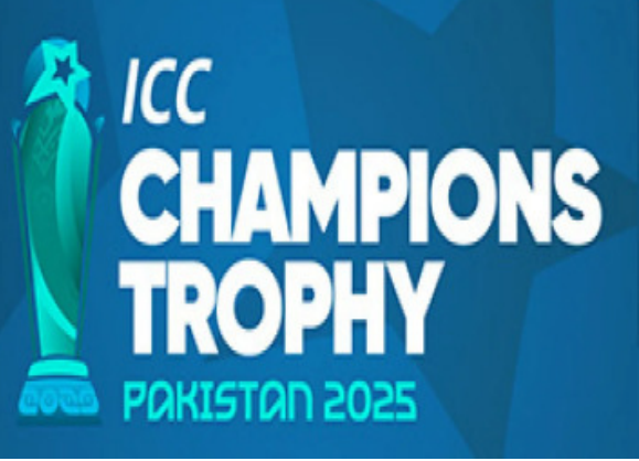
ଭାରତ ବିପକ୍ଷରେ ଅଭିଯାନ ଆରମ୍ଭ କରିବା ପରେ ମ୍ୟାଚ୍ ରୁ ୨୪ ମ୍ୟାଚ୍ ହାରିଛି । ସେଥିମଧ୍ୟରେ ରହିଛି

ଭୁବନେଶ୍ୱର, ୧୪।୨ : ଚାମ୍ପିୟନ୍ସ ଟ୍ରଫି-୨୦୨୫ ଆରମ୍ଭ ହେବାର ପରଦିନ ଅର୍ଥାତ୍ ଚଳିତ ଫେବୃଆରୀ ୨୦ ତାରିଖରେ ଭାରତ ତାର ଅଭିଯାନ ଆରମ୍ଭ କରିବ । ବାଂଲାଦେଶ ହେବ ଟିମ୍ ଇଣ୍ଡିଆର ପ୍ରଥମ ପ୍ରତିଦ୍ୱନ୍ଦ୍ୱୀ । ଏହି ପ୍ରତୀକ୍ଷିତ ମ୍ୟାଚ୍ ପୂର୍ବରୁ କିନ୍ତୁ ବାଂଲାଦେଶ ପୂର୍ବ ବିଜେତା ଭାରତକୁ ଦେଇଛି ଚେତାବନୀ । ଏହି ଦଳର ଅଧିନାୟକ ନଜମୁଲ ହୁସେନ ସାଝୋ କହିଛନ୍ତି, ଆମେ ବିଜେତା ହେବା ଲକ୍ଷ୍ୟ ନେଇ ଚାମ୍ପିୟନ୍ସ ଟ୍ରଫିକୁ ଯାଉଛୁ । କେବଳ ଆମେ ନୁହଁ, ସମସ୍ତ ୮ଟି ଯାକ ଦଳ ବିଜେତା ହେବାର କ୍ଷମତା ରଖିଛି । ସମସ୍ତେ ସମ ପରିମାଣରେ ବଳିୟାନ । ମୁଁ ଭାବୁଛି ଆମ ପାଖରେ ସେହି ଦକ୍ଷତା ଅଛି । ଏଥିଲାଗି କଠିନ ପରିଶ୍ରମ କରୁଛୁ । ଭାବୁଛି ଆମ ଲକ୍ଷ୍ୟ ହାସଲ କରିପାରିବୁ ।